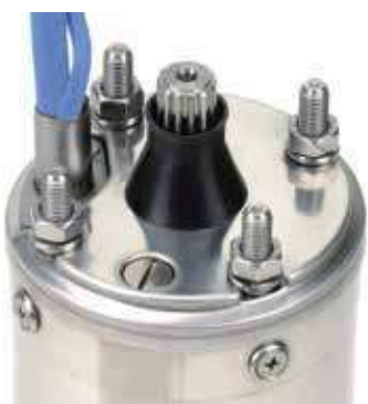
Coperchio in acciaio inossidabile