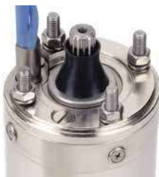
Acciaio inossidabile AISI 316